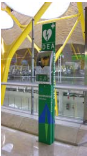
Aéroport de Madrid

Pompiers de : France, USA, Inde, Brésil, Espagne, Italie, Pays-Bas, Angleterre... Hôpitaux, Cliniques, CHU, Cabinets médicaux... Mairies, Préfectures, Conseils Généraux, Armées, Aéroports, Universités, Douanes... Floride, Louisiane, Nouveau-Mexique, l'Utah, le New Jersey, l'Arkansas, le Maine